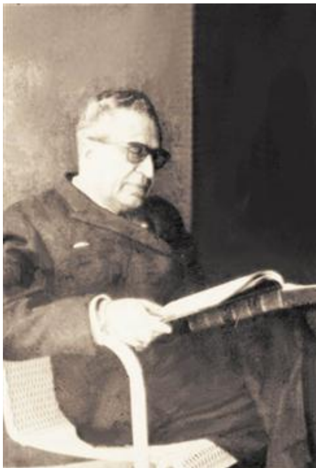
Jaime Torres Bodet