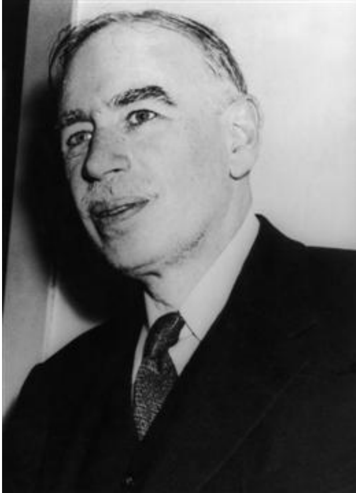
John Maynard Keynes