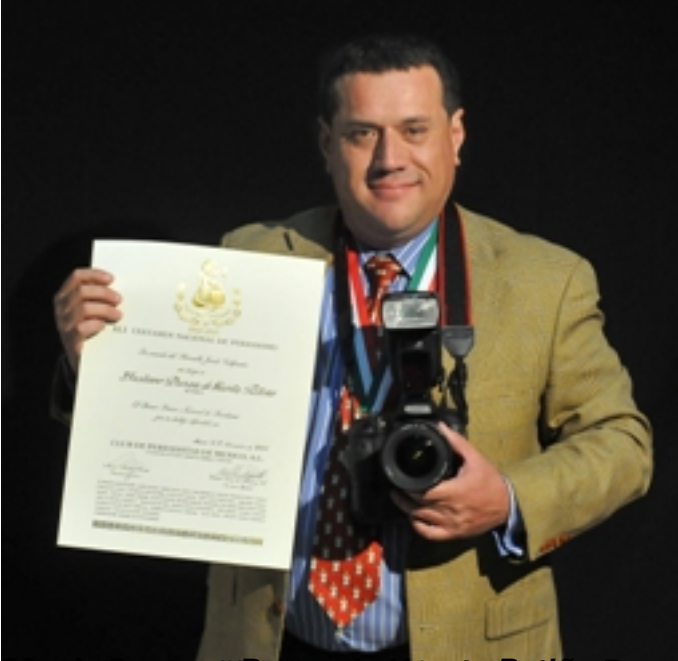
Rafael Domínguez Premio de Fotografía