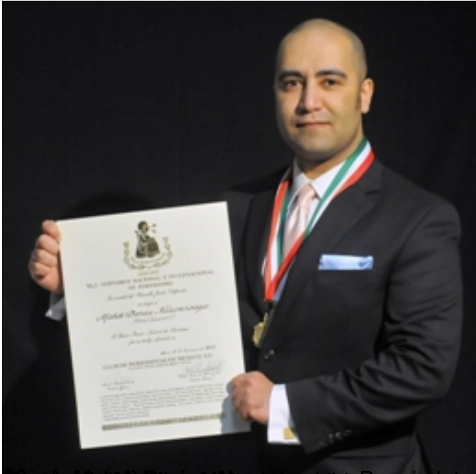
Proceso de comunicación regional por la integración Socioeconómica y la cultura, en el programa de radio "El día de hoy" de la emisora de radio "El día de hoy", escrita,

Escrito por Administrador Adicional Sábado, 25 de Febrero de 2012 10:33