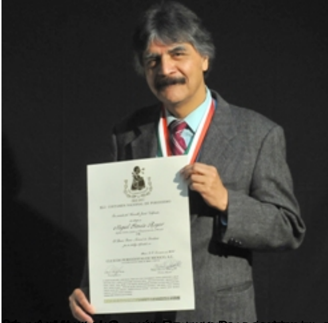
El día de hoy en la categoría de Economía y Finanzas, en el programa de radio "El día de hoy" de la emisora de radio "El día de hoy", escrita,