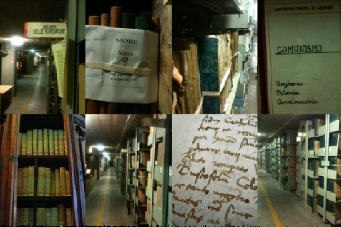
El archivo de la biblioteca de la Universidad de Salamanca, donde se encuentran los papeles de

Escrito por Irene Hernández Velasco Miércoles, 01 de Agosto de 2012 18:35