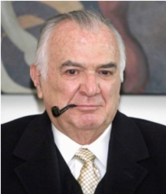
De la Madrid

(guiada por don Jesús Reyes Heróles), pero su carrera burocrática la desarrolló en las áreas bancaria, financiera y hacendaria del sector público. Del encargo de subsecretario de Hacienda y Crédito Público pasó a la Secretaría de Programación y Presupuesto (SPP), y de ésta a la Presidencia de México.