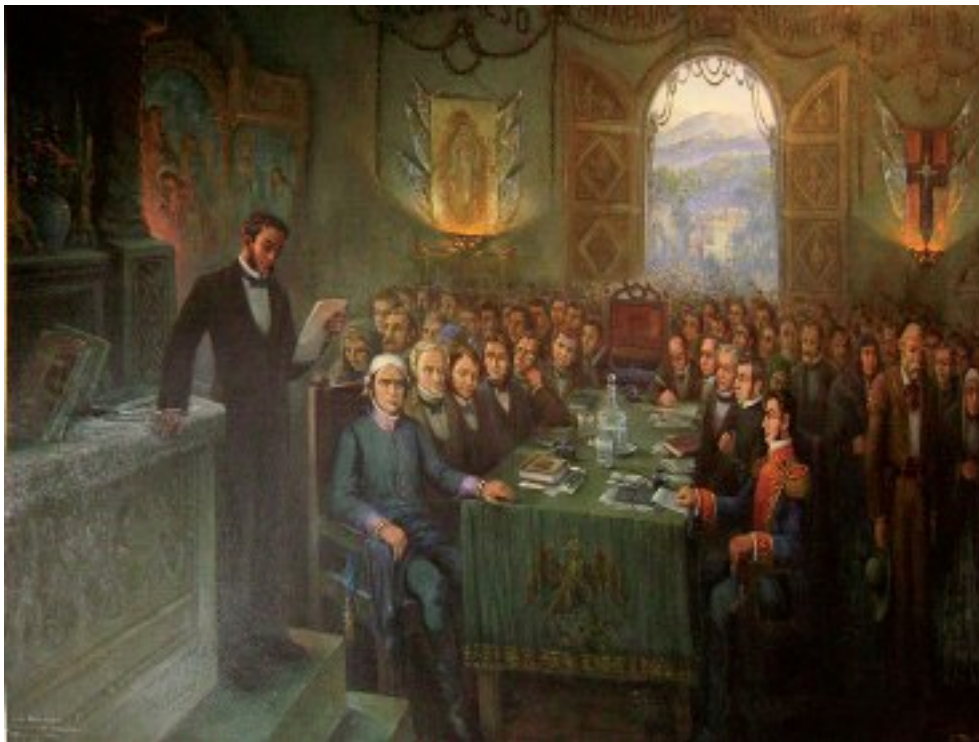
Congreso de Anáhuac

Fingiendo un papel reflexivo -cosa insólita en un temperamento tan poco cultivado en las artes políticas- Vicente Fox atribuyó la derrota del PRI en 2000, a que no supo vender sus logros de 70 años de supremacía en el poder presidencial.