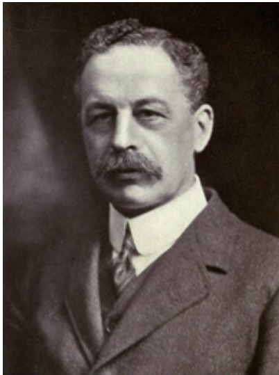
Sir Halford John Mackinder

hace 17 años que evoca los Balcanes globales, como prolongación de la teoría geopolítica del británico Halford McKinder, y que profundiza en su reciente entrevista a la revista Foreign Policy en la que invita a China a un G-2 secreto contra Rusia y Europa ( http://goo.gl/VUE6vf ).