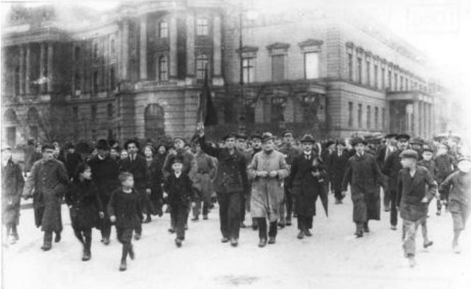
Alemania, inicios de la Revolución de noviembre.