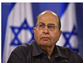
Moshe Yaalon, jefe de la inteligencia militar israelí (de 1992 a 1996), jefe del estado mayor israelí (de 2002 a 2005), diputado del Likud (de 2009 a 2013), ministro de Defensa del gobierno Netanyahu (desde 2013).

Mientras Estados Unidos, por un lado, así como Francia y Turquía, por otro lado, tratan de rediseñar el Levante a su manera, Alfredo Jalife-Rahme observa la continuidad existente entre el plan de Oded Yinon –que data de 1982– y el de Moshe Yaalon, de 2014. Aunque respalda públicamente las visiones de los demás, Israel sigue adelante con su propio proyecto de balcanización de la región.