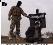
Ejecución de un oficial iraní vestido