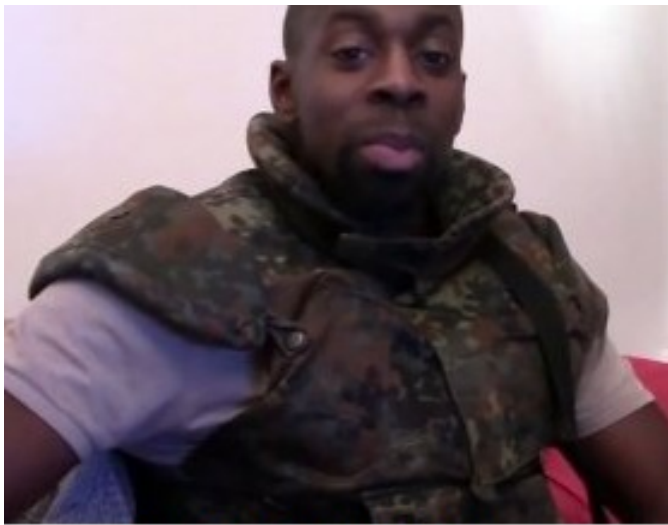
Amedy Coulibaly terrorista.

La historia de Charlie Hebdo, simplemente no se salva, si lo crees, no eres rival para un musulmán.