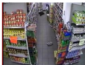
Ataque a supermercado

Algunos sostienen que los musulmanes son lo suficientemente estúpidos como para pegarse un tiro en la cabeza en este camino. Pero ¿cómo reconciliamos tal supuesta estupidez con los presuntos ataques profesionales musulmanes 9/11 y Charlie Hebdo?