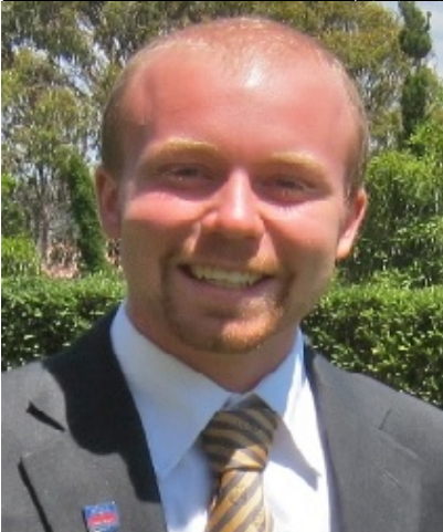
Mark Stevenson, autor del montaje