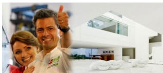
Angélica Rivera de Peña.

Hoy, la Carta Magna es un documento más, que es utilizado por el poder para “legitimar” sus intereses facciosos, en perjuicio de la nación entera. De 1917 a la fecha ha sufrido más de 600 cambios (incluidos los que tienen que ver con los artículos transitorios).