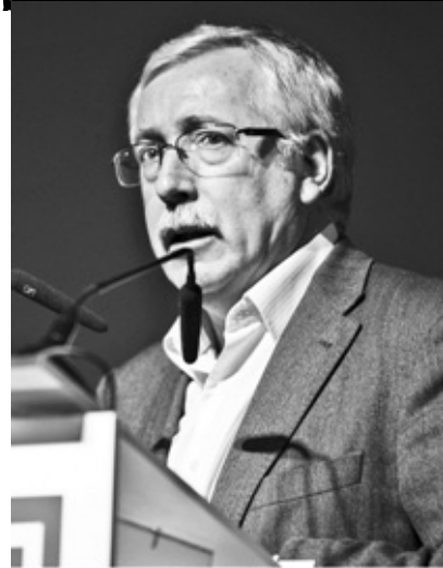
Ignacio Fernández Toxo