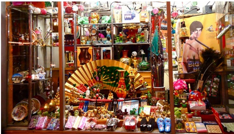
Una invasión comercial y cultural que ya no pasa desapercibida por los españoles.

Los chinos invaden las ciudades y pueblos importantes de esta nación. Venden de todo, a toda hora y a cualquier precio por de abajo del usual. La calidad es lo de menos. Es la apariencia la que manda y, sobre todo, para que los euros rindan más.