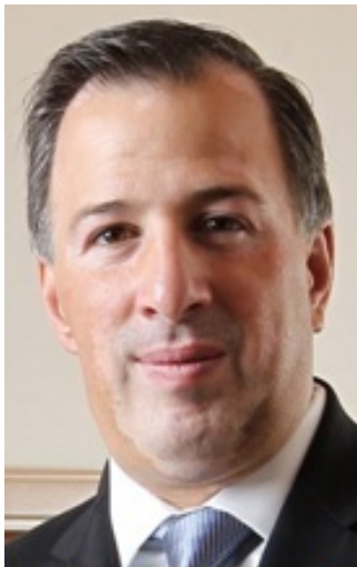
José Antonio Meade Kuribreña

Variables para sortear restricciones a depósitos en dólares americanos; “los ingresos de las organizaciones mexicanas de tráfico de drogas son lavados utilizando variaciones en los métodos basados en el comercio, en particular después de que México puso restricciones a los depósitos en dólares estadounidenses. Por ejemplo, los cheques y las transferencias de las llamadas ‘cuentas de embudo’ son utilizados por los ‘brokers’ de dinero con sede en México para adquirir bienes que se intercambian por pesos en México, o al vender dólares para las empresas mexicanas. La combinación de un sector financiero sofisticado y un gran sector informal de efectivo complican las medidas contra el lavado de dinero.” Traducción del inglés Dra. Addy Merino.