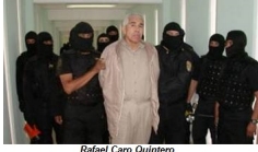
Rafael Caro Quintero

Variables para sortear restricciones a depósitos en dólares americanos; “los ingresos de las organizaciones mexicanas de tráfico de drogas son lavados utilizando variaciones en los métodos basados en el comercio, en particular después de que México puso restricciones a los depósitos en dólares estadounidenses. Por ejemplo, los cheques y las transferencias de las llamadas ‘cuentas de embudo’ son utilizados por los ‘brokers’ de dinero con sede en México para adquirir bienes que se intercambian por pesos en México, o al vender dólares para las empresas mexicanas. La combinación de un sector financiero sofisticado y un gran sector informal de efectivo complican las medidas contra el lavado de dinero.” Traducción del inglés Dra. Addy Merino.