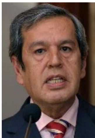
Rogelio Ortega Martínez.

Rogelio Ortega Martínez, Gobernador interino de Guerrero reconoce el volumen de la producción de opio-heroína blanca, un tercio de la población involucrada y el carácter geoestratégico de Tierra Caliente “un millón de personas trabajan en actividades relacionadas con el narcotráfico, son el primer productor de opio en el mundo”.