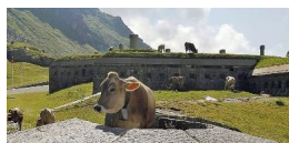
Restos abandonados hoy de fortines de los años 30.

La historia marca que las primeras aldeas en el actual territorio suizo se ubicaron allá por el año 5300 aC, diversas tribus dominaron el espectro como los Hallstatt o los Tene, hasta que aparecieron los Helvetii por el 300 aC, luego los Helvetii fueron aplastados por el ejército romano de Julio Cesar en el año 58 AC, para el 15 AC todo el territorio fue integrado al Imperio Romano. Ya en nuestra era, entre los siglos IV y VIII los Helvetii fueron dominados por alemanes y franceses. Como parte del Imperio de Carlomagno los francos dividieron el territorio en el año 843, recién para el año 1000, en la baja edad media, se re unificó según las fronteras existentes durante el Imperio Romano.