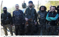
Ribeldes sirios con lo que parece parte de un paracaidas.

¿Están locos en Washington causando prácticamente por su parte todos estos importantes incidentes internacionales que pueden detonar el inicio de una Tercera Guerra Mundial?