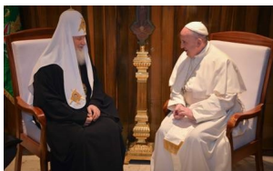
El patriarca Kiril, de la Iglesia ortodoxa rusa, y el papa Francisco, jerarca de la Iglesia católica, durante el histórico encuentro del viernes pasado en el aeropuerto José Martí de La Habana

CON MOTIVO DEL AÑO LUNAR , el pontífice jesuita argentino Francisco congratuló al pueblo chino y al mandarín Xi, hecho inédito en 2 mil años de historia de la Iglesia católica que se acerca en forma simultánea y pasmosa al patriarca Kiril de la Iglesia ortodoxa rusa después del cisma de 1054.