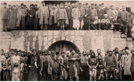
Genocidio Armenio; abajo armenios esperando su ejecución. Arriba el gobernador otomano Haydar Pasha y sus soldados. Agosto 1914