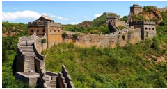
LA MURALLA CHINA

El emperador Adriano ordenó la construcción de un muro (122-132 d.C.) para "separar a los bárbaros de los romanos", como se señala en la Historia Augusta donde resalta la única referencia clásica a la primera frontera fortificada de Europa. Esta edificación dividió de costa a costa el norte de Inglaterra a lo largo de 117.5 kms. (4) En tanto, "el Muro de Antonino, también llamado Muralla de Antonino, fue erigida por Quinto Lolio Urbico, gobernador romano de Britania, por mandato del emperador romano Antonino Pío a partir del año 142 d.C. a unos 160 km al norte de la muralla de Adriano.