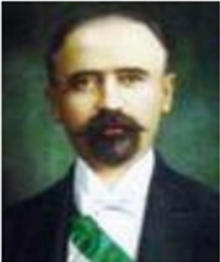
Francisco I. Madero