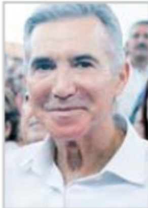
Roberto Madrazo Pintado.