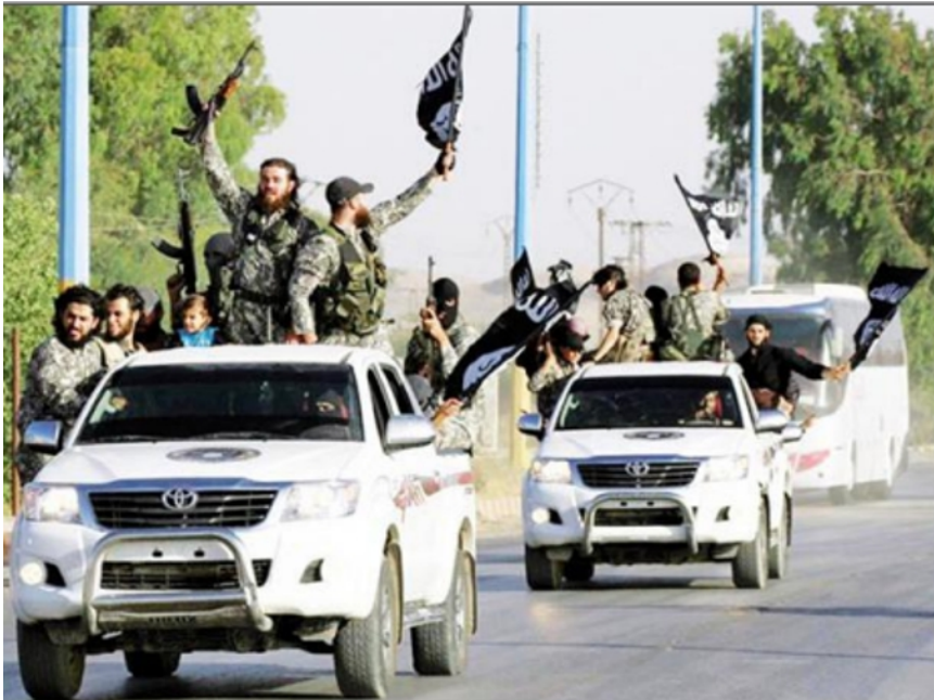
Muchas otras operaciones de envío de armamento a los yihadistas se han realizado en secreto, por ejemplo, los casos del carguero Luftallah II , capturado por la marina libanesa el 27 de abril de 2012.

Escrito por Thierry Meyssan Lunes, 31 de Julio de 2017 19:39