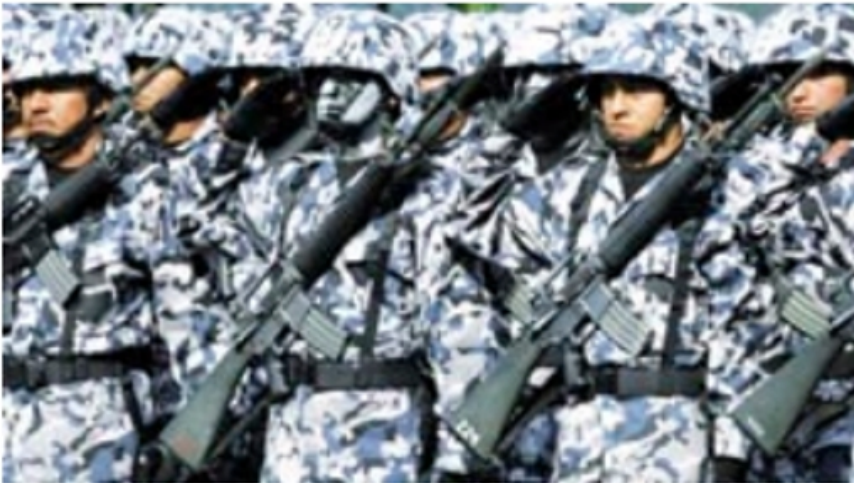
Luego se volvieron Zetas.

Escrito por Juan Ramón Jiménez de León Martes, 01 de Agosto de 2017 06:45