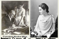
El presidente Woodrow Wilson