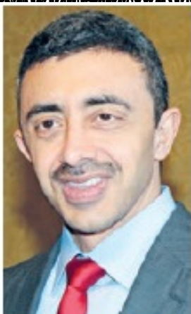
Abdullah bin Zayed Al-Nahyan.