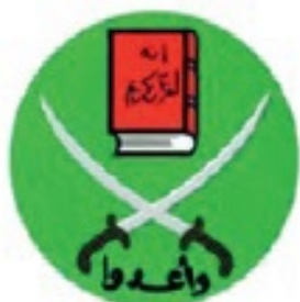
Simbolo de la Hermandad Musulmana

Escrito por Thierry Meyssan Lunes, 30 de Diciembre de 2019 14:48