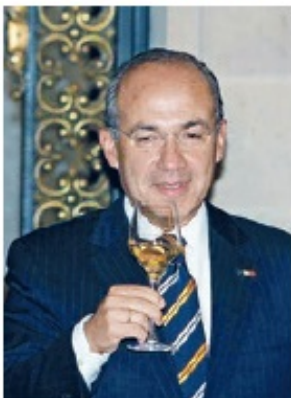
Cuba niega entrada a Felipe Calderón y se queda bebiendo en un bar.