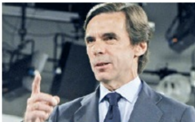
José María Aznar.