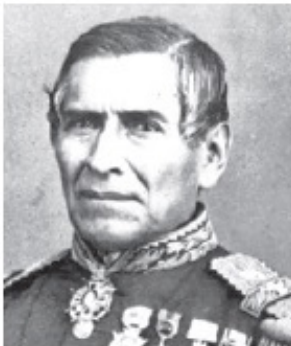
Juan Nepomuceno Almonte.