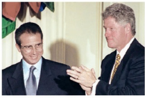
Ernesto Zedillo, en el lado posible donante de la isla y sus derivados a William Clinton.