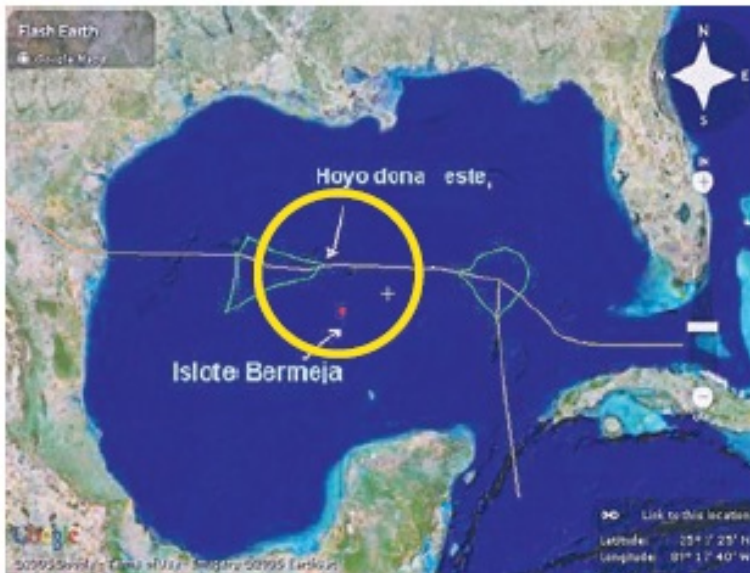
islote Bermeja y Hoyo de Dona.

asunto mucho más grave de lo que se piensa, de la desaparición de la Isla Bermeja, cuya ubicación es indispensable para delimitar el mar patrimonial de México y las riquezas que encierra.