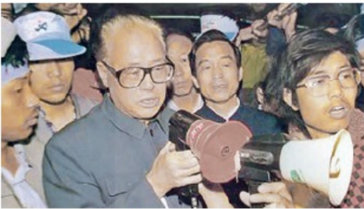
Zhao Ziyang, el dirigente que fue borrado por apoyar las protestas estudiantiles.