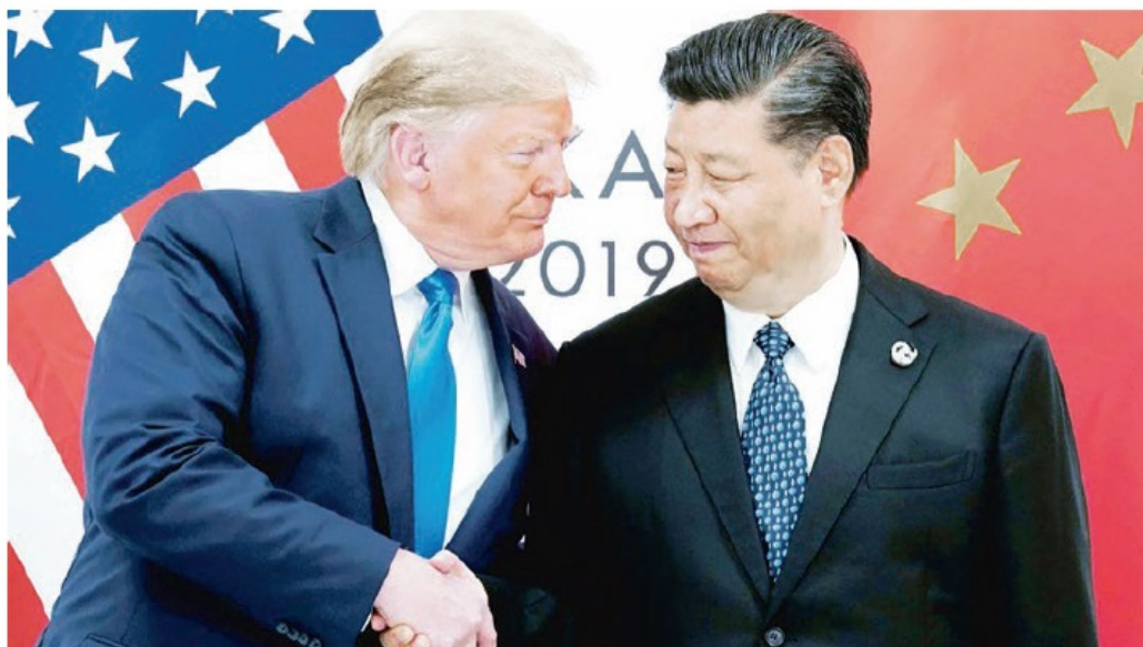
Feroz, la ofensiva de EUA contra China