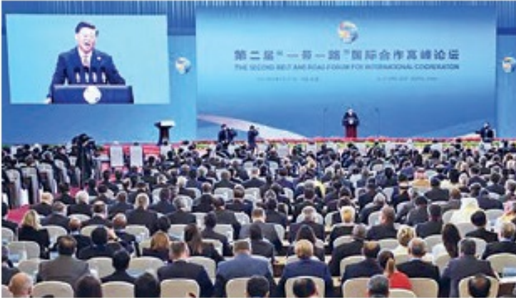
Xi Jinping, defenza de la Ruta de la Seda en cumbre de Pekín.