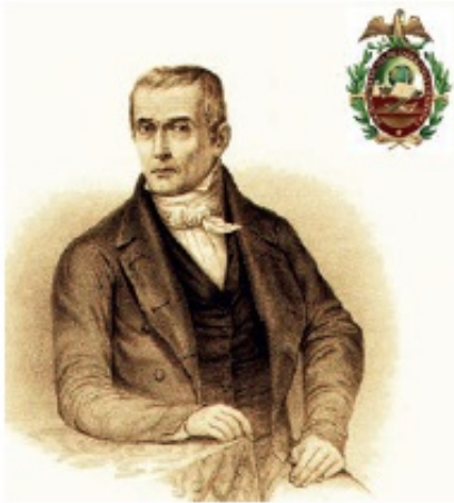
Valentín Gómez Farías, Vicepresidente también suspendió el pago de la deuda