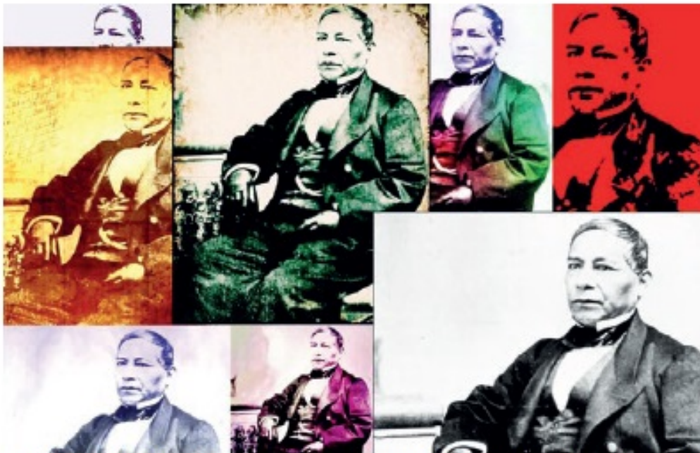
El 17 de julio de 1861, durante la presidencia de Benito Juárez, el Congreso suspendió por dos años los pagos de la deuda, pues consideró prioritario atender las necesidades de la Nación.

NO DE LOS NÚMERO DE FUNDACIONES DE LA DEUDA EXTERNA DE MÉXICO HOY, Y AYER