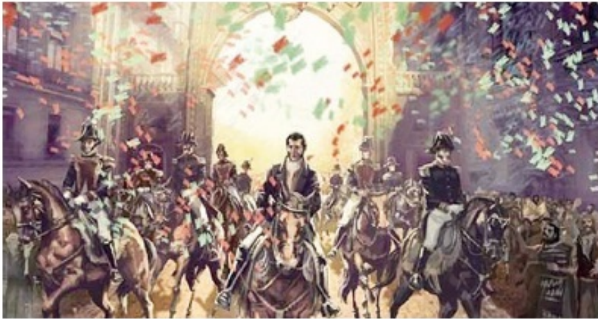
Guadalupe Victoria, primer presidente de México que suspendió el pago de amortización de la deuda