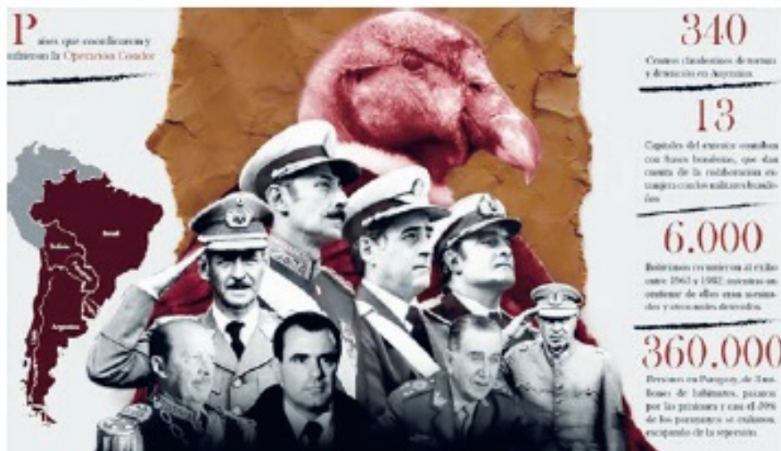
Plan Cóndor, los golpistas apoyados por la CIA contra los pueblos de América Latina