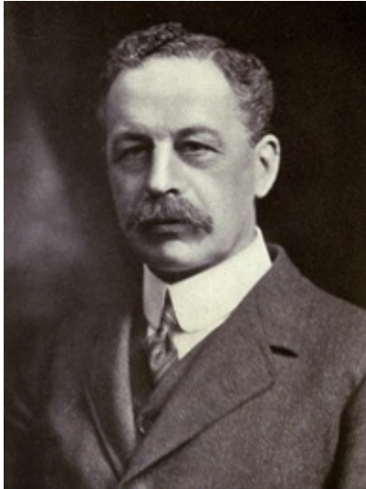
Sir Halford John Mackinder

hace 17 años que evoca los Balcanes globales, como prolongación de la teoría geopolítica del británico Halford McKinder, y que profundiza en su reciente entrevista a la revista Foreign Policy en la que invita a China a un G-2 secreto contra Rusia y Europa ( http://goo.gl/VUE6vf ).