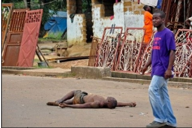
Cadáveres en las calles ante la indiferencia.

biólogos del Centro de Control de Enfermedades Infecciosas, organismo perteneciente a El Pentágono, desembarca en una base militar del Ártico para impedir que el grado cero de un virus letal descubierto en ese lugar se expanda a otras zonas del orbe.