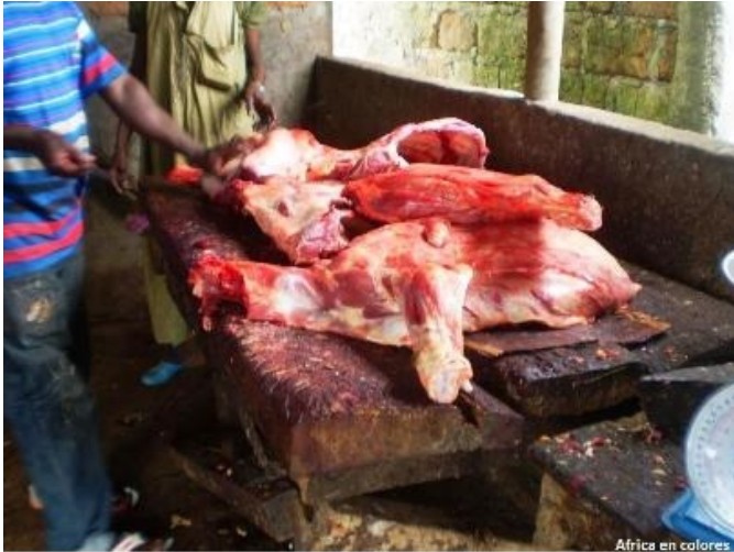
Africa en colores