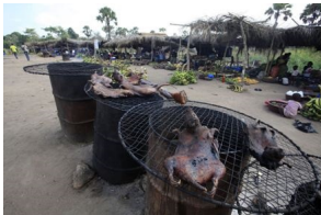
El nocivo consumo de carne de murciélago

Las firmas farmacéuticas que desarrollan un fármaco paliativo para combatir el virus que azota África reportan su investigación a Fort Detrick, un enclave del Departamento de Defensa norteamericano acusado de desarrollar armas biológicas.