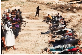
Aseesatos a mansalva, técnica de ISIS.

Sin embargo, al día siguiente de su reelección, Barack Obama obligaba al general David Petraeus a renunciar a su cargo como director de la CIA y descartaba mantener a Hillary Clinton como miembro de su nueva administración. Así que, a inicios de 2013, la coalición se reducía prácticamente a Francia y Turquía mientras que Estados Unidos hacía lo menos posible. Por supuesto, era el momento que el Ejército Árabe Sirio esperaba para iniciar su inexorable reconquista del territorio.