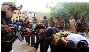
Daesh y sus atrocidades

En su discurso sobre el Estado de la Unión pronunciado el 23 de enero de 1980, el entonces presidente Jimmy Carter planteaba la doctrina que lleva su nombre: Estados Unidos considera que los hidrocarburos del Golfo son indispensables para su economía y que por lo tanto le pertenecen. Así que cualquier forma de poner en duda ese axioma será considerada “un acto contra los intereses vitales de los Estados Unidos de América y ese acto será rechazado con todos los medios necesarios, incluyendo el uso de la fuerza militar”. Con el tiempo, Washington se ha dotado del instrumento necesario para aplicar esa política –el CentCom– y ha extendido su zona vedada hasta el Cuerno de África.