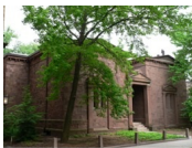
El centro de skull and bones en la universidad de Yale.

Desde 1972, el último verdadero líder que tuvo el viejo PRI, don Jesús Reyes Heróles, en un macizo discurso en el que legitimó la Revolución Mexicana, hizo referencia a Los científicos de la dictadura porfiriana, denunció sus vocaciones discriminatorias y excluyentes, y lanzó una certera advertencia contra la tecnocracia en ciernes y su pretensión de constituirse en poder político.