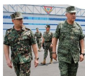
Cienfuegos y Soberón.

En años pasados, el primer ataque de la guerrilla en Cd Madera a un cuartel y el del EZL en Chiapas y el del ERPI en Oaxaca, son datos duros para el Ejército-Marina. Abrir los cuarteles significa capitular, eso es impensable. Filtrado por el CISEN “el Ejército considera que dentro del movimiento de Ayotzinapa están metidos personajes vinculados con guerrillas mexicanas, quienes querrían entrar a los cuarteles no para buscar a los jóvenes sino para mapearlos, ubicar dónde guardan las armas y detectar flancos vulnerables por donde pudieran ser atacados”, el CISEN ubica como “objetivos de atención especial” a 18 líderes sociales que han participado en las protestas con los padres de Ayotzinapa. Están vinculados con la guerrilla o con el narcoterrorismo.