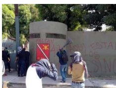
Batallón de Iguala.

Con una definición del narcoterrorismo de Wikipedia vemos como este no tiene nada que ver en absoluto con el maoísmo, ni con versiones ideologizadas. El narcoterrorismo es la cooperación y alianza estratégica entre mafias del narcotráfico y grupos armados extremistas así como otros grupos insurgentes o terroristas. Como veremos con mayor puntualización, las guerrillas, maoístas o no, de la guerra fría han evolucionado en guerrillas blancas al servicio del terror del narcotráfico y de las transnacionales que operan los enclaves económicos en la Cuenca del Pacífico.