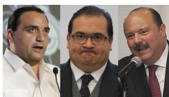
Tres gobernadores priistas, Tomás Dorrego, Quintana Roo, Javier Duarte, Veracruz, y César Duarte, Chihuahua