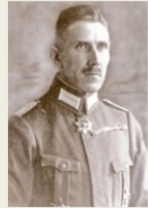
Franz Von Papen, hacia 1914.