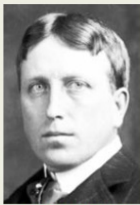
William Randolph Hearst.