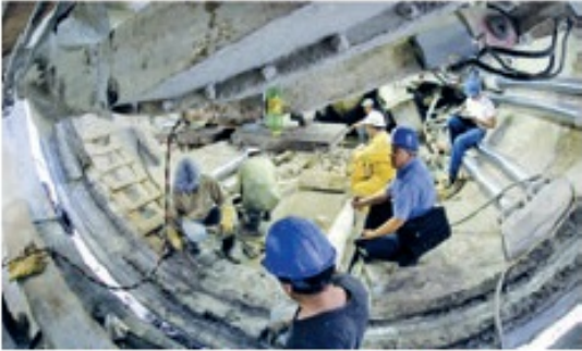
Equipo sofisticado de perforación del TFO