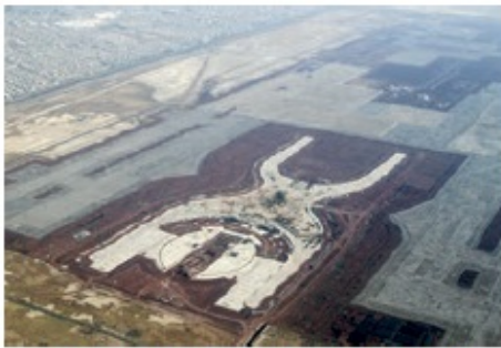
NAIM CANCELADO. Parte de los objetivos del TEO